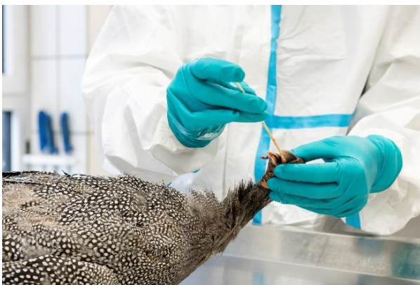
Abb. 2: Tupferprobenentnahme bei einem Perlhuhn

Treten innerhalb von 24 Stunden in einem Bestand erhöhte Verluste oder ein deutlicher Legeleistungsabfall auf, muss eine Infektion mit Influenzaviren mit geeigneten Untersuchungen ausgeschlossen werden. Ein Nachweis von Influenzavirus führt zur Keulung des Geflügels in dem betroffenen Bestand. Außerdem werden von dem zuständigen Veterinäramt Schutz- und Überwachungszonen eingerichtet. In diesen Zonen werden bestimmte Maßnahmen, wie zum Beispiel Untersuchungen von Geflügelbeständen oder Verbringungsverbote von Tieren und tierischen Produkten ergriffen, um eine Weiterverbreitung des Erregers zu unterbinden.