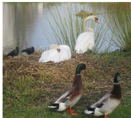
Abb. 1: Wildvögel an einem Stadtweiher

Infektionen mit diesen HPAIV führen zu einer hohen Sterblichkeit im Bestand. Es besteht die Gefahr der schnellen Ausbreitung durch direkte und indirekte Kontakte zwischen infizierten Vögeln.