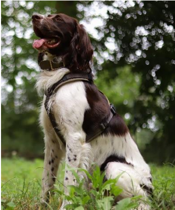
Abbildung 1: Jagdhund im Wald.

Viele Hunde- und Katzenhalter kennen (und fürchten) sie: Zecken im Fell ihrer Vierbeiner. Diese Parasiten können nach Spaziergängen und sonstigen Aufenthalten im Freien Hunde und Katzen „besiedeln“ (Abb. 1). Dort angekommen, stechen sie in die Haut, nehmen Blut auf und können verschiedene Krankheitserreger übertragen. Diese Erregerübertragung geschieht oft erst Stunden oder sogar Tage nach der Besiedelung. Daher ist ein frühzeitiges Finden und Entfernen der Zecken wichtig. Auch vorbeugende Zeckenschutz-Maßnahmen sind sinnvoll und sollten regelmäßig bei den Besuchen in der Tierarztpraxis besprochen werden.