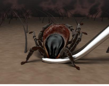
Abbildung 3: Entfernung einer Zecke mit der Pinzette.

Zecken sollten vorsichtig und mit gleichmäßigem, geraden Zug entfernt werden, wobei es mehrere Sekunden dauern kann, bis sich die Zecke lockert. Zur Entfernung verwenden Sie eine Zeckenzange, Zeckenkarte oder Pinzette, um die Zecke so hautnah wie möglich zu fassen (Abb. 3). So wird der Körper nicht gequetscht und die Zecke kann vollständig entfernt werden. Bei einer Quetschung des Zeckenkörpers können Krankheitserreger in den Wirt gelangen. Während der Zeckenentfernung sollte auf Öl, Alkohol, Benzin oder Klebstoff verzichtet werden. Nach der Entfernung empfiehlt sich das Auftragen eines Zeckenschutz-Präparates, da sich noch kleinere und leicht zu übersehende Zeckenstadien auf dem Wirt befinden können. Entfernte Zecken sollten getötet und dann gut verpackt über den Hausmüll entsorgt werden. Zur Tötung kann die Zecke in hochprozentigen Alkohol oder Desinfektionsmittel eingelegt oder mit einem harten Gegenstand zerdrückt werden. Hierbei ist unbedingt darauf zu achten, dass Sie nicht mit austretenden Körperflüssigkeiten der Zecke in Kontakt kommen. Daher die Zecke vorher z. B. in eine feste Plastiktüte einzuwickeln. Eine weitere Möglichkeit stellt auch das Tiefgefrieren über 24 Stunden bei - 20 °C dar.